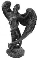
imagem de lilith